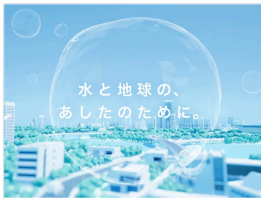
水と地球の、あした のために。