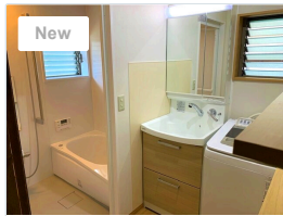
狭い場所でも使いや すくしたいリフォ...