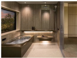
シンラ（戸建住宅向 け）