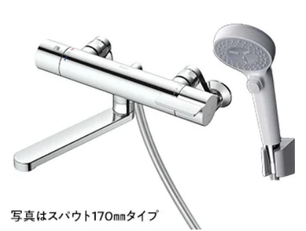
写真はスパウト170mmタイプ