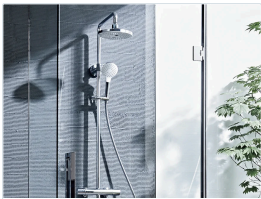
SHOWER シャワー 金具