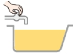
蛇口を 閉じて湯はり完了

■ 給湯温度設定範囲 水 / 35℃～48℃（1℃刻み） / 50℃ / 60℃