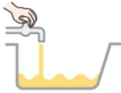
蛇口を 開いて湯はり開始