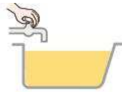
蛇口を 閉じて湯はり完了

■ 給湯温度設定範囲 水 / 35℃～48℃（1℃刻み） / 50℃ / 60℃