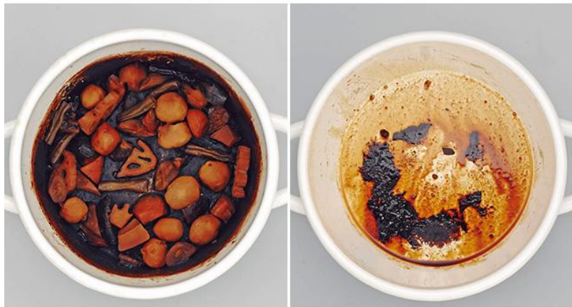
鍋底全体が焦げついています。